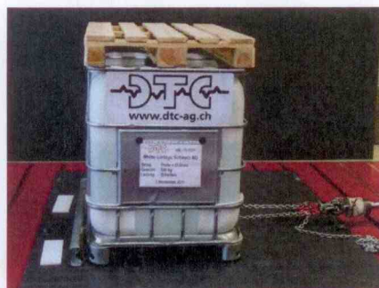
Abb. 3 : Zugversuch mit Gitterbox 500kg in Querrichtung