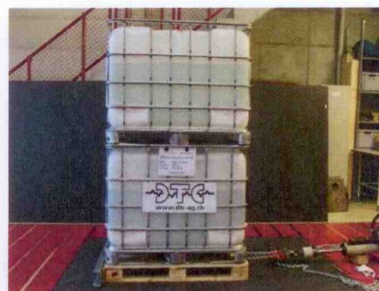
Abb. 2 : Zugversuch mit Europalette 1000kg in Längsrichtung