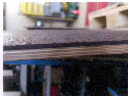
Abb. 1 : Rutschhemmende Beschichtung